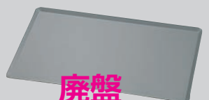
⑫SASA アルミ 天板 (アノダイズ加工仕上)