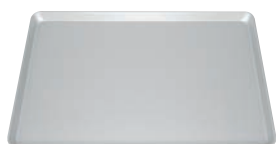
⑪アルマイト加工 ヨーロッパ軽量天板