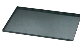
⑬マトファー/ブウジャ ストレートエッジ ベーキングトレイ 4550.01