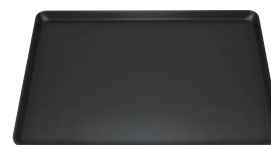
⑧フッ素加工 ヨーロッパ軽量天板