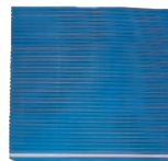
④ ⑤ ⑥