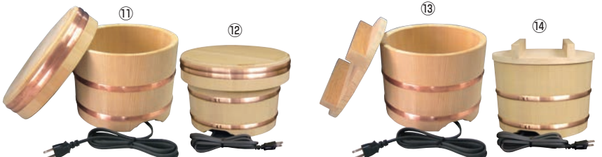
さわらの呼吸がシャリに適度な湿度を補給!

●木地の呼吸がシャリに適度な湿度を補給し、さらにヒータープレートで揚り易い美味しい湿度を保ちます。 ●シャリのストック容器から小分けし、より良いシャリの状態でお客様へサービスができます。 ※内容量によってシャリの乾燥時間に差が生じます。 ※シャリ投入時の温度により落ち着くまで時間が掛かります。