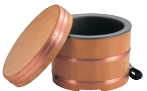
⑦よい電気おひつ すしシャリ用