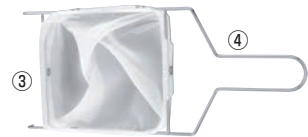
※フィルターとフレームは別売りです。