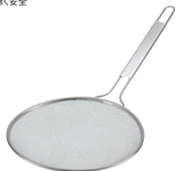
④TS 18-8 共柄すくい網 30cm