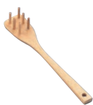
⑭竹製 そうめんすくい