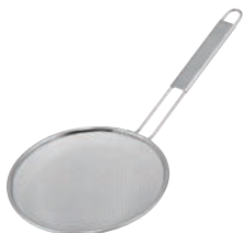
⑦TS 18-8 油こし 背油用11メッシュ