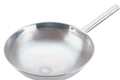
①UK 18-8 パンチング スクイザル