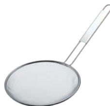
⑨TS 18-8 ラーメンスープこし 極細目