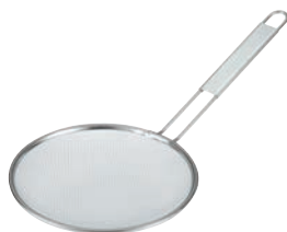
⑧TS 18-8 油こし ラーメンスープ用24メッシュ