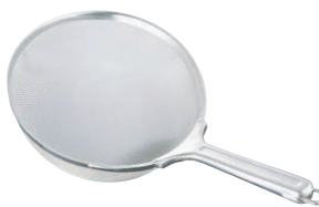
②BK 18-8 すくいざる