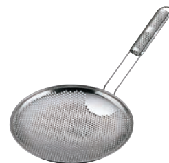
⑥UK 18-8 パンチング 背油こし