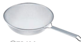
③TS 18-8 楽しくそばすくい網 35cm