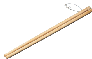
⑩竹製 麵箸 26-206