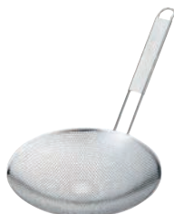
⑤UK 18-8 パンチング 背油こし 23cm