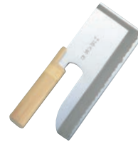
⑩木柄 そば切庖丁 F-738 別梱包