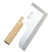
⑦麺切庖丁「切れ者」 A-1013 別梱包