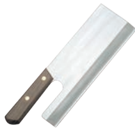
⑤全鋼 麺切庖丁 別梱包

外寸:700×200 厚さ:15 重量:0.7kg 材質:桐 ●手前をL型の足で高くすることによって庖丁をまな板に平らに立てることができるので、そばが切り易いです。