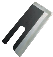
⑧正本 本霞・玉白鋼 そば切り庖丁 別梱包