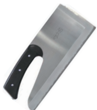
⑫ステンレス鋼 別型 麺切庖丁 切れ者 A-0020 別梱包

刃渡:330 全長:330 重量:750g 背厚:2.5 材質:モリブデン鋼 ●柄がドロップしているため、バランス良く使用できます。