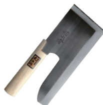
⑬ステンレス鋼 麺切庖丁 切れ者 別梱包

刃渡:330 全長:330 重量:860g 背厚:2.8 材質:金IIステンレス鋼