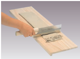
④そば切りまな板 L型