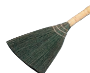
⑭卓上型 ほうき 別梱包