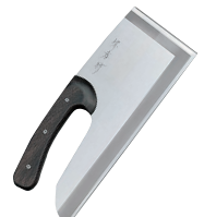
⑪堺孝行 モリブデン鋼 そば切り庖丁 別梱包