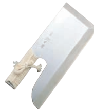
⑥麺切庖丁「切れ者」 A-1012 別梱包