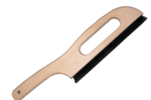
⑮そば・粉用 はけ A-1850 別梱包