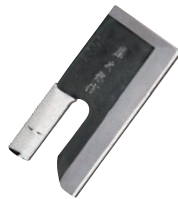
⑨共柄 そば切庖丁 別梱包