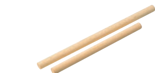
⑦EBM 木製 めん棒