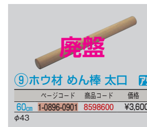
⑨ホウ木材 めん棒 太口 ㊦