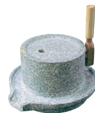
③石臼 小 ㊦ 直 Aのアイコン

外寸:225×320×H370 容量:1.2ℓ 電源:単相100V/100W 重量:12kg 処理能力:乾燥大豆2~3kg/時間 付属品:60メッシュ手フルイ、粉受容器、掃除ブラシ ※粉のキメはワンタッチハンドルで粗〜細調節をします。