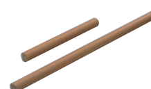
⑫アルミ テフロン パイプ型 麺棒