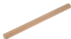
⑩桜材 (国産) 麺棒