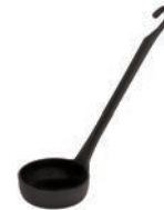
⑧パデルノ ピザレードル 150cc 12968-10

外寸:350×600×H300(蓋開時:H680) プレス板サイズ:φ350 電源:単相100V 消費電力:1,000W ●ラすぐ延ばすのが難しい、厚さ1~3のクリスピータイプのピザやトルティヤ等のクラストを簡単に成型できます。 ●20秒でピザ生地を一発成型 ●手作り本格派クリスピータイプのピザが簡単に!