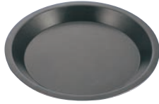
①EBM アルミスーパーコートパイ皿