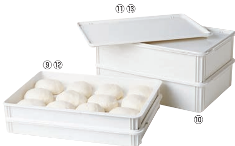
⑨ピザ生地ボックス 浅型 DB18263CW