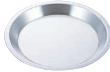
②EBM アルミ パイ皿