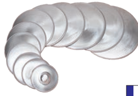
⑤マトファー ボル・オ・パン 12枚セット 82651