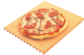
⑥デロンギ ピザストーン PS-CN

セット内容 φ110 φ120 φ130 φ150 φ160 φ170 φ190 φ200 φ215 φ225 φ235 φ250 ●ピザ生地などを丸く切る場合ボル・オ・パンの縁にそって切ると簡単です。