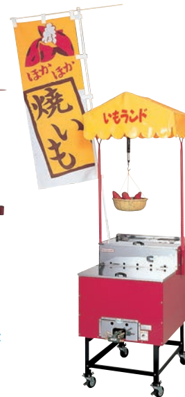
①ガス 焼きいも機 いもランド AY-500型