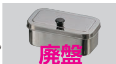
③EBM 18-0 プレス お好みヤクミ入