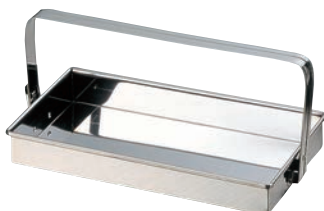
①EBM 18-0 お好み岡持ち