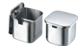
⑧クローバー モリブデン プレス 角タレ入