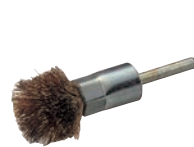
㉑ワイヤーボタ タコ焼きブラシ (ドリル用)