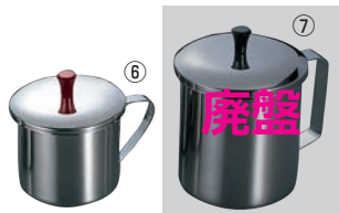
⑥モリブデン ソースポット 小