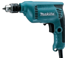
㉒マキタ 電動式ドリル 6412 Ⅱ