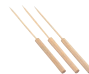
⑲竹たこ焼ピック (100本入)