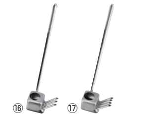
EBM 18-8 ウナギタレカケ