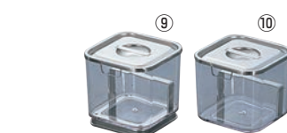
⑨UK ポリカーボネイト 角タレ入 台付

●蓋の裏に引掛金具が付いているので、蓋の置き場所に困りません。 ●タレ切り付で便利です。