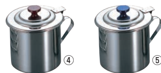
EBM モリブデン 蝶番付 ソースポット