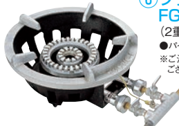
⑥フラッシュ ガスコンロ FG-3型 (2重バーナー、平型ゴク) ●パイロット(種火付) ※ご注文の際は、平型と立型のゴクが ございますので指定ください。