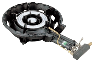
①ガスコンロ SG-2 (2重バーナー) ●パイロット(種火付)