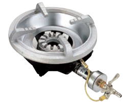
④フラッシュ ガスコンロ FG-1型 (1重バーナー、平型ゴク) ●パイロット(種火付) ※平型ゴクのみ仕様です。