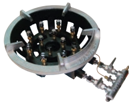
②ガスコンロ TG型 ●パイロット(種火付) ※ご注文の際は、平型と立型のゴクが ございますので指定ください。