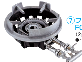
⑦フラッシュ ガスコンロ FG-4型 (2重バーナー) 特立ゴク専用 ●パイロット(種火付)