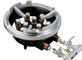
③ジャンボ ガスコンロ TG型 ●パイロット(種火付) ※立型ゴクのみ仕様です。 ※TG-15は特立ゴクのみになります。 (⑩のゴク参照)