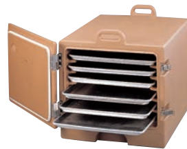
(コーヒーベージュ)