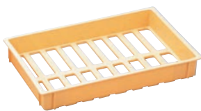
⑥ 麺コンテナ ㊦