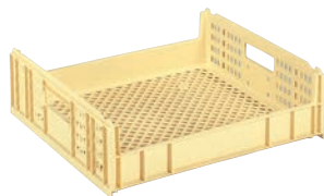
⑬ サンコー サンテナー クリーム ㊦