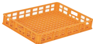
⑨ サンコー 麺コンテナ オレンジ ㊦