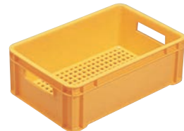
⑮ ボトル用 コンテナ ㊦