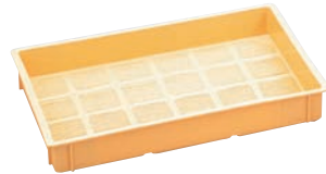
⑧ 麺コンテナ ㊦