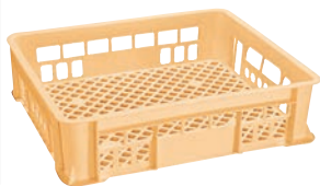
⑫ セキスイ コンテナ ㊦