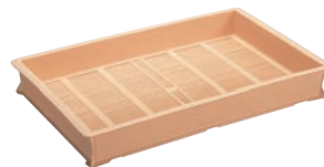
⑪ セキスイ メン兼用コンテナ CMKIE ベージュ ㊦