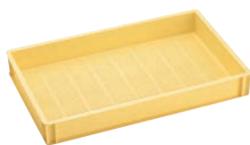
② 麺コンテナ ㊦