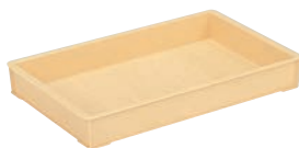
⑩ サンコー 麺コンテナ ㊦