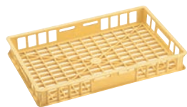
③ 麺コンテナ ㊦