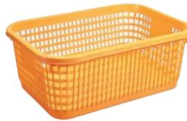
⑭ セキスイ ヤサイコンテナ ㊦