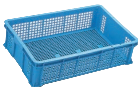
① 麺コンテナ ㊦