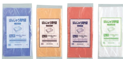
⑫ ⑬ ⑭ ⑮

厚み:0.013mm 材質:HDPE ●ばんじゅう用内袋を使用することで、ばんじゅうの洗浄が容易で衛生的です。 ●食材の入れ替えが簡単で、作業性が向上します。 ●着色袋の使い分けによって、食材の区分け、便数管理が可能です。