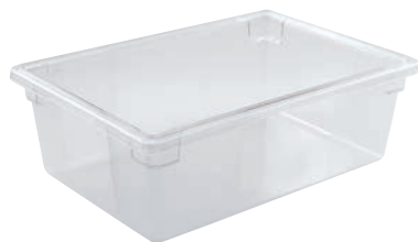
⑤ フードボックス 洗