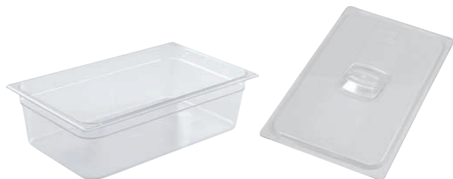
① フードパン 洗