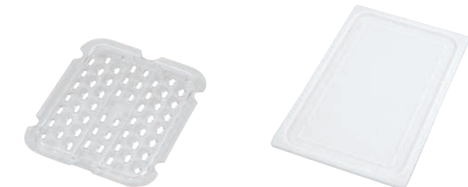
③ フードパン用 底面排水トレー 洗

●測に引っ掛け用の穴が付いております。 (1/4、1/8を除く) ※1/8は取手が付いてません。