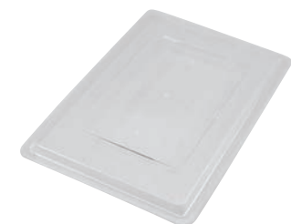
⑥ フードボックス用 カバー 洗