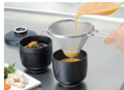
茶碗蒸し作りでとき卵がきれいにこせ、まろやかさアップ