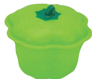
⑮ココット パプリカグリーン