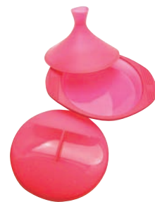
⑱マストラッドファミリーパピヨット& タジン蓋セット ラズベリー

容量:1,500ml 材質:シリコン樹脂 耐熱温度:-40~220℃ ●おりたためるので、狭い場所にもカンタン収納できます。 ●フタは、調理用と保存用の2種類