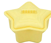
⑬ココット スターイエロー