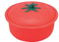
⑭ココット トマトレッド