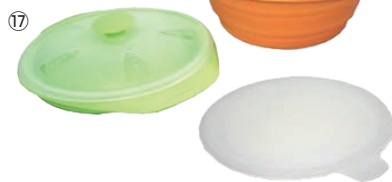
シリコン折りたたみキャセロール