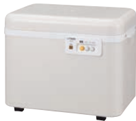
④タイガー 餅つき機 カジまん