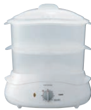
②フードスチーマー