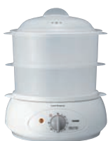
①フードスチーマー