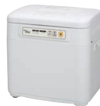
⑥マイコン餅つき機 かがみもち