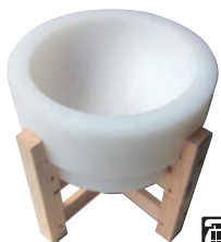
⑦プラスチック餅臼 (木台付)