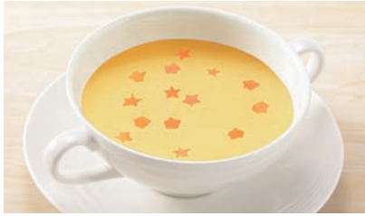
製品動画はこちらから