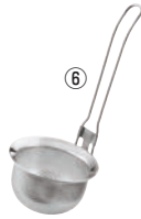
⑥UK 18-8 パンチングストレーナー (みそこし)