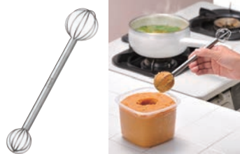
⑱計量みそマドラー