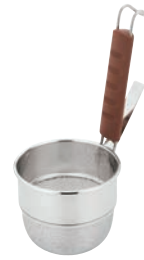
③UK 18-8 シリコン柄 みそこし