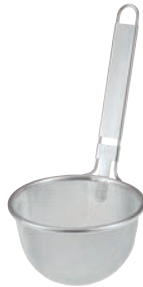
②18-8 プロみそこし (16メッシュ)