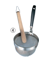
④18-8 PC柄 万能 みそこし (こし棒付)