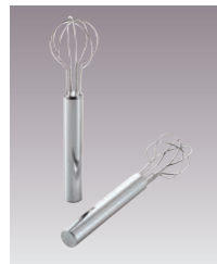
⑲18-8 パイプ柄 味噌取マドラー

●大小の丸い計量部を味噌に差してくりと回すと簡単に味噌の計量ができます。 ●毎日の味噌汁が、簡単に一定の味付けで作ることができます。 ●味噌を計量したら、そのまま味噌溶きして使うことができます。 ●卵溶きや調味料を混ぜる時にも便利に使えます。