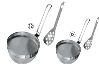
18-8 共柄万能こしセット (レンゲ付)