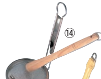
⑭18-8 ふた付 みそこし (こし棒付)