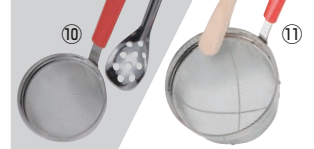
⑩ミニ 万能こし (レンゲ付)