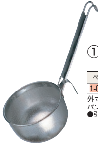
①UK 18-8 パンチング こしテボ