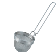
⑰18-8 共柄ミニ味噌こし (14メッシュ)