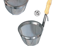
⑮夕華 18-8 みそこし