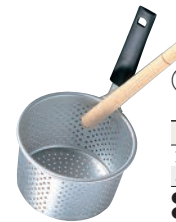
⑯アルマイト PC柄 みそこし (こし棒付)