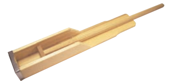
⑭木製天突 突くゾウさん