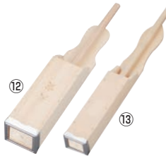
スプルス とこ天突