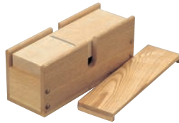
②木製 業務用 かつ箱 切