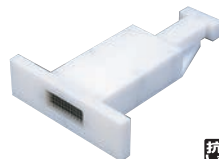
⑯ポリエチレン 抗菌 こんにやく突 切