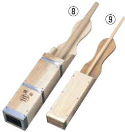
⑧木製 業務用 天突 1812 (特上) 切