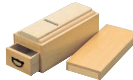
③木製 かつ箱 匠