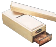
⑥木製 かつ箱 中 M型 切