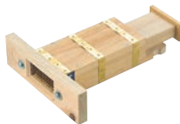
⑮木製 デラックス こんにやく突