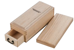
④木製 かつ箱 いろいろ端 旨味 切