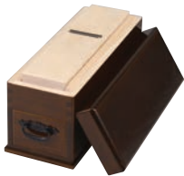
①木製 本職用 かつ箱 宗近 切