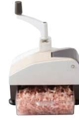
⑦かつおぶし削り機 オカカ 切