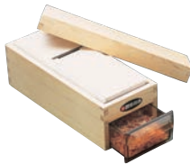
⑤木製 かつ箱 L型 切