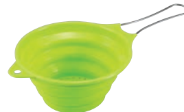
⑪ ハンドル付きシリコン ストレーナー グリーン