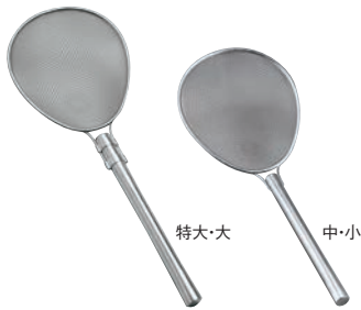
① 18-8 パイプ柄 小判型 プロすいのう