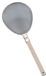
④ 18-8 木柄 小判型 プロすいのう

④φ270 ⑤φ340 重量:600g パンチング穴径:2.2mm 深さ:100