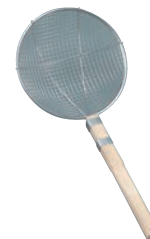
⑥ 18-8 木柄 丸型 スクイアミ 極荒