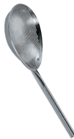
② UK 18-8 パンチング 小判スクイ玉揚