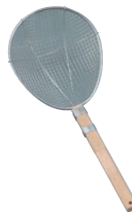
⑤ 18-8 木柄 スイノー型 スクイアミ 極荒