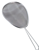
⑦ 18-8 手付 スクイザル