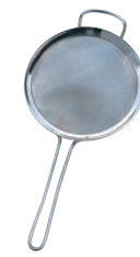
⑧ ゲフ 18-10 シーブ (ストレーナー)