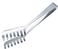
① 18-8 厚手スパゲティ tong 30cm