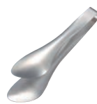
⑪ 柳宗理 18-8 ステンレストング 穴なし