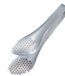
⑫ 柳宗理 18-8 ステンレストング 穴あき