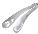
⑮ フレンチ tong