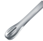
⑯ ハサム tong