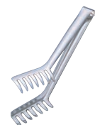
④ 18-8 ワンピース足付 スパゲティ tong