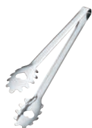
⑨ T=ONE 18-0 パスタ (麺) tong