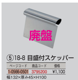
⑤ 18-8 目盛付スケッパー