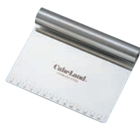
④ 18-0 目盛付スケッパー