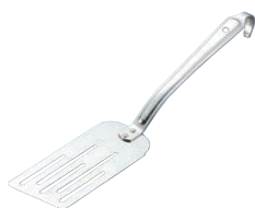
⑭エコクリーン 18-8 ケーキターナー