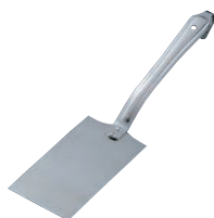
⑪エコクリーン 18-8 ギョーザ返し