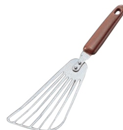
⑯MA 18-0 バターピーター