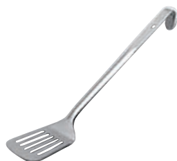
②MA 18-8 DXターナー