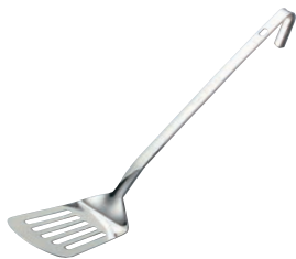
①UK 18-8 S型ターナー