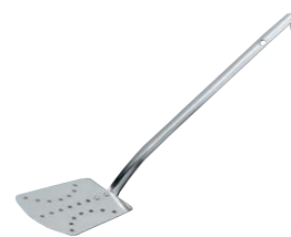
④エコクリーン 18-8ターナー