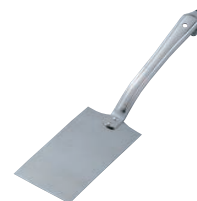
⑫MA 18-0 ギョーザ返し