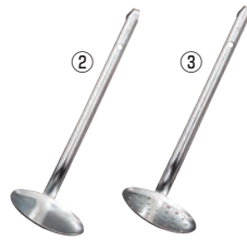
②MA 18-0 スキンマー 穴無