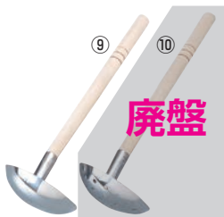
⑨T 18-0 木柄 レードル 穴無