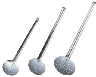
①デバイヤー 18-10 ワンピース スキンマー