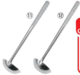
⑪EBMオールステンレス プラスト加工 和食レードル 穴無