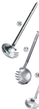
⑯UK 18-0 うどんお玉