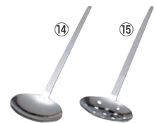
⑭T 18-0 共柄 穴無 カキ揚お玉