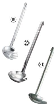
⑲MA 18-0 レードル柄うどんお玉