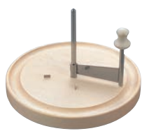
②ボスカ ジョーロール チーズスライサー