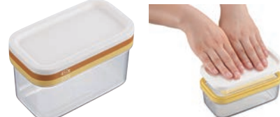
⑯バターカッティングケース

●蓋を押すだけで手を汚さずに、バターを約5gに薄切りカットできます。 ●カットしたバターは、そのまま冷蔵庫にストックできます。