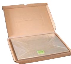
⑲チーズ用セロファン

材質:アルミニウム合金 ●先端部は熱が伝わりやすく、堅いバターにスムーズに入っていくよう1mmになっています。