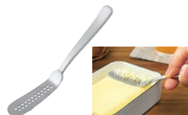
⑰18-8 とろける! バターナイフ

●蓋を押すだけで手を汚さずに、450gのバターを10gのブロックにカットできます。 ●カットしたバターは、そのまま冷蔵庫にストックできます。