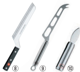
⑧ヴォストフ チーズナイフ