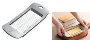
⑭ワイヤーでスーッと切れる バターカッター