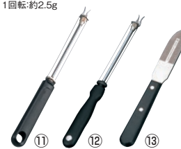
⑪ウエストマーク チーズスライサー