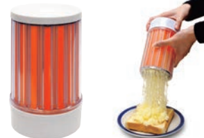
⑤イージーバター バターフォーマー オレンジ