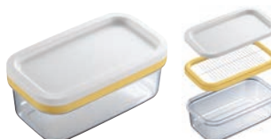
⑮カットできちゃうバターケース

●ずーっと押し続けて40個にカットできます。 ●200gのバターなら一切れ約5gになるので、お菓子やパンづくりの分量の目安にもなります。