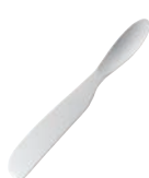
⑱手の熱で溶かして切れる バターナイフ