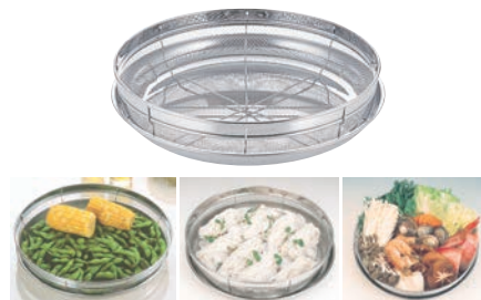
⑥ 18-8 浅ザル&トレーセット