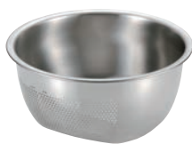
⑦ 3WAY 水切りボール

材質:網/18-8ステンレス 枠・トレー/18-0ステンレス ●麺、野菜の水切りや鍋もの等の、材料の盛り付けに最適です。