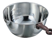
⑨ 18-8 目盛付 手付 片口 ボール