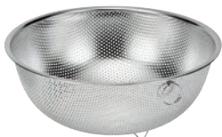
⑤ シェフズボール ステンレス足付パンチングボール (リング付)