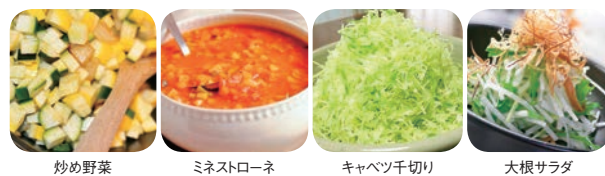
炒め野菜 ミネストローネ キャベツ千切り 大根サラダ

09 砥石・庖丁差し 10 まな板 11 調理機械 (下ごしらえ) 04 鍋全般 05 ブランドキッチン コレクシオン 06 オープンウェア 07 ホテルパン・ ガストロノームパン 08 庖丁