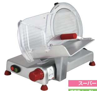
スーパー 焼肉店、しゃぶしゃぶ店