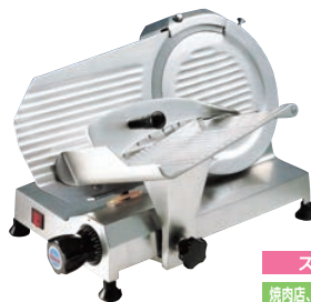
スーパー 焼肉店、しゃぶしゃぶ店