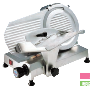
スーパー 焼肉店、しゃぶしゃぶ店

外寸:530×440×H350 電源:単相100V (50/60Hz) 90W 定格時間:30分 厚さ調整:0~15mm 重量:14kg 切断有効寸法:最大径φ140mm 作動方式:手動式 用途:ハム、ソーセージ、しゃぶしゃぶ(半冷凍)、チャーシュー、キャベツ