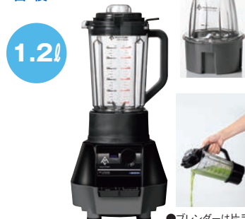
③ マルチシェフ ミルブレンダー 91