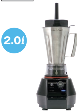
② マルチシェフ ブレンダー (ステンレスボトル) 91