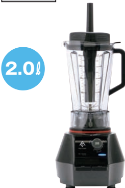
① マルチシェフ ブレンダー (強化樹脂ボトル) 91