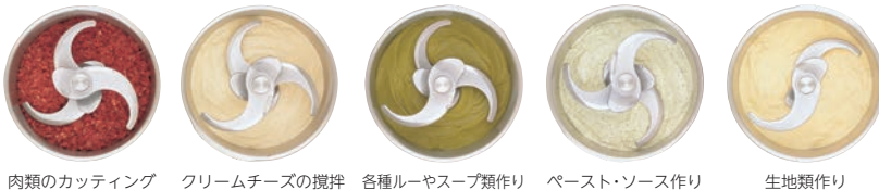
肉類のカッティング クリームチーズの攪拌 各種ルーやスープ類作り ペースト・ソース作り 生地類作り