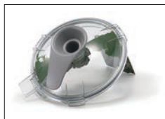
スクレーパーを回転(手動)させると処理物を掻き落とすことができます。