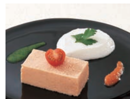
食材を個々に処理した後