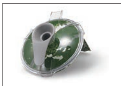
ブrikサーでほうれん草をペースト状にした直後