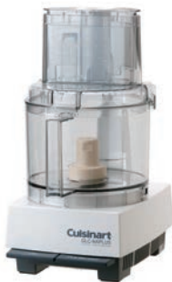
①クイジナート フードプロセッサ