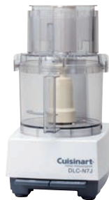
②クイジナート フードプロセッサ