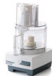
③クイジナート フードプロセッサ