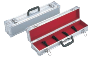
④スペシャルグレード シルバー ナイフケース 小 ㊦

フリー 外寸:570×125×H100 内寸:550×108×H 75 ※P345-⑩の庖丁等などと組み合わせでのご使用 をお薦めします。 ※刃渡36cmまで収納可能 鍵付