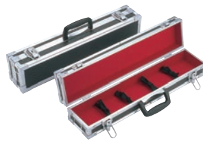
③スペシャルグレード ハードタイプ ナイフケース 小 ㊦

10丁入 外寸:570×285×H100 小物収納スペース:550×90×H50 材質:ジュラルミン製 ※刃渡36cmまで収納可能 鍵付