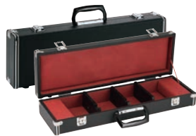
⑤料理学校用 庖丁ケース 6丁入

フリー 外寸:570×125×H100 内寸:550×108×H 75 材質:ジュラルミン製 ※P345-⑩の庖丁等などと組み合わせでのご使用 をお薦めします。 ※刃渡36cmまで収納可能 鍵付