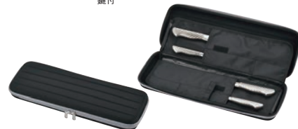
⑧ソフト庖丁ケース (4丁用) ㊦