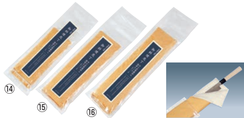
ラップラ2クン 塩化ビニール製 庖丁保管ケース サビ止除菌剤入り ㊦