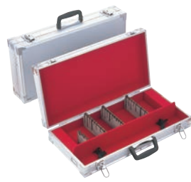
②スペシャルグレード シルバー ナイフケース 大 ㊦

10丁入 外寸:570×285×H100 小物収納スペース:550×90×H50 材質:ジュラルミン製 ※刃渡36cmまで収納可能 鍵付