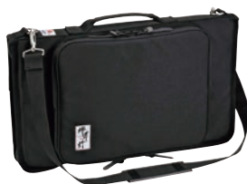
⑨堺孝行 ナイフバッグ ㊦

外寸:440×165×H50 重量:430g 材質:ポリエステル ※刃渡24cmまでの庖丁2丁とペティナイフ2丁が収納可能 鍵付