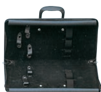
⑥学校用 庖丁ケース (5丁入) ㊦