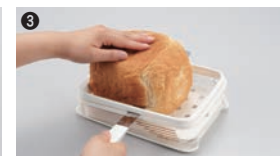
ナイフをスリットに通しゆっくり動かしながら切ります。