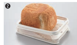
パンを横に寝かせるように置きます。