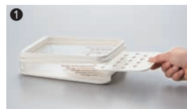
厚み調節板を、切りたい厚みに合わせて本体枠に差し込みます。

材質:安全ガード・厚み調節板・底板/ABS樹脂 ナイフあて/ポリプロピレン 本体枠・フード/スチロール樹脂 ●サンドイッチに使える1cmから、リッチな3cmまで5段階に厚みの調節ができます。