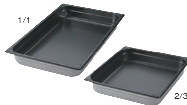
⑥EBM 18-8 ホテルパン ノンスティック加工