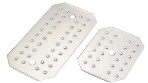
⑤EBM 18-8ホテルパン用目皿

アンチジャムシステム 特殊構造で、はまり込みを防ぎ、更に強度UP。 もしはまり込んでも外しやすい。