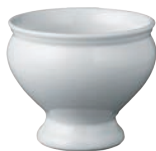
⑩陶器 丸トリフ 蓋無