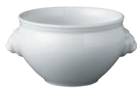
⑧陶器 ライオンスープ 蓋無