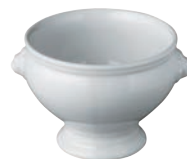
⑨陶器 ライオントリフ 蓋無