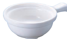
⑮手付 スープボール