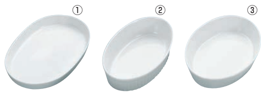
①オーバルベーキング グラタン皿