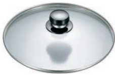
⑤エレックマスターライト用 ガラス蓋