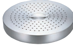
⑥スチームプレート