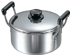
⑧MA 18-0 深型 ソースポット