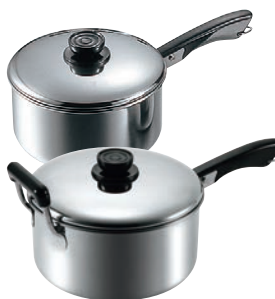
⑩MA 18-0 深型 ソースパン