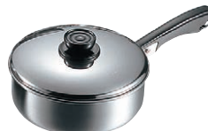
⑪MA 18-0 浅型 ソースパン