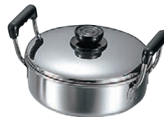
⑨MA 18-0 浅型 ソースポット