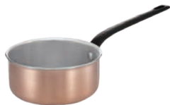
⑤レズレー プレミアムライン ソテーパン