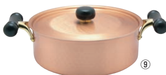
⑨銅IHアンティック浅型鍋 IH-104