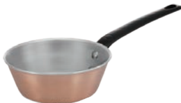
⑥レズレー プレミアムライン ソテーゼ