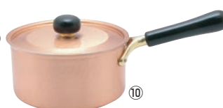
⑩銅IHアンティック片手鍋 IH-101