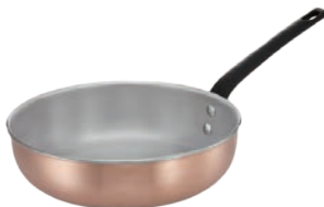
④レズレー プレミアムライン フライパン