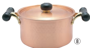
⑧銅IHアンティック両手鍋 IH-102