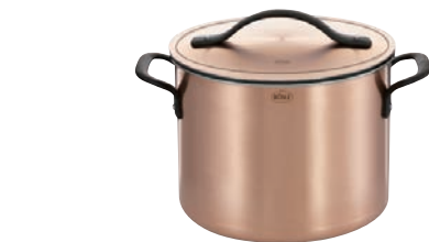
①レズレー プレミアムライン ストックポット