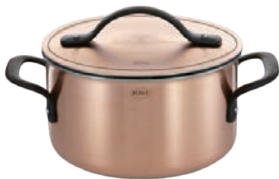
②レズレー プレミアムライン ハイキャセロール