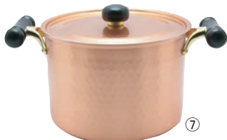
⑦銅IHアンティック深型鍋 IH-103