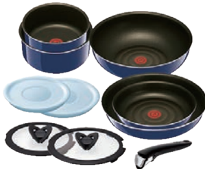
⑦グランブループレミアム セット10