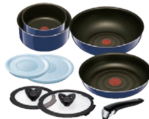
⑧グランブループレミアム セット9