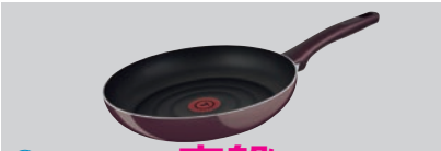
①ティファール 廃盤 サンライズプレミア フライパン