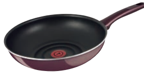
②ティファール サンライズプレミア ウォックパン