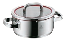
⑫WMF ファンクション4 ローキャセロール