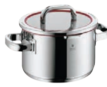
⑪WMF ファンクション4 ハイキャセロール