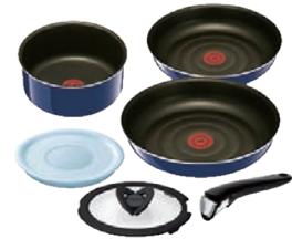
⑨グランブループレミアム セット6