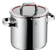
⑩WMF ファンクション4 ストックポット