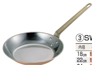
③ SW 銅 フライパン