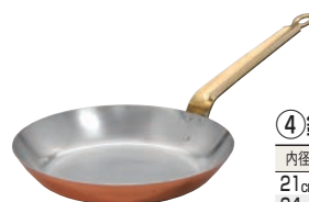
④ 銅 フライパン