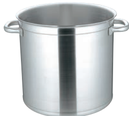
①マトファー／ブウジャ ストックポット 6840(蓋無)