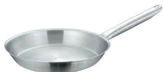
⑦マトファー／ブウジャ フライパン 6850