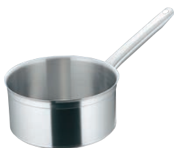
④マトファー／ブウジャ ソースパン 6810 (蓋無)