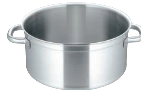
③マトファー／ブウジャ キャセロール 6830 (蓋無)