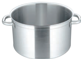
②マトファー／ブウジャ ソースポット 6800(蓋無)