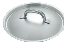
⑧マトファー／ブウジャ 鍋蓋