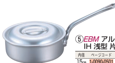
⑤ EBM アルミ プロシェフ IH 浅型片手鍋 (目盛付)