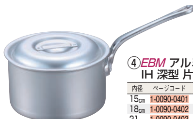
④ EBM アルミ プロシェフ IH 深型片手鍋 (目盛付)