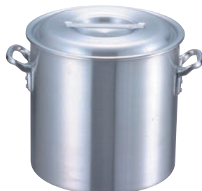
① EBM アルミ プロシェフ IH 寸銅鍋 (目盛付)