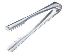
⑤ 18-8 IKD 抗菌 棒型 アイストング