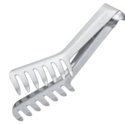
③ 18-8 IKD 抗菌 スパゲティトング