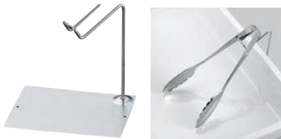
⑥ 18-8 IKD抗菌 トングレスト L型