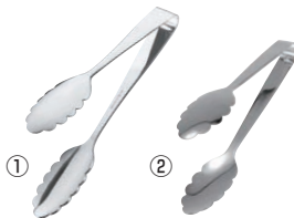
①② 18-8 IKD抗菌 ロール式厚口 万能トング