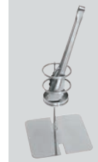
⑧ 18-8 IKD抗菌 スーパートング 箸ホルダー用 受皿