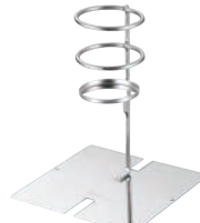
⑦ 18-8 IKD抗菌 スーパートング 箸ホルダー シングル