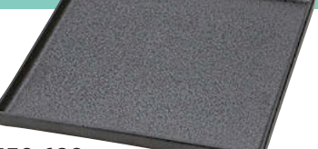
ラ559-638 24.5cmスクウェアプレート 24.5×24.5×2cm (磁) JPN 3,400円