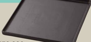
ラ559-338 24.5cmスクウェアプレート 24.5×24.5×2cm (磁) JPN 3,400円