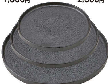
ラ559-648 プレートM φ18.5×1.8cm (磁) JPN 1,800円