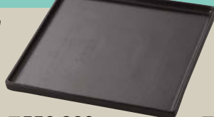
ラ559-328 21cmスクウェアプレート 21×21×2cm (磁) JPN 2,600円