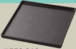
ラ559-318 18cmスクウェアプレート 18×18×2cm (磁) JPN 1,800円