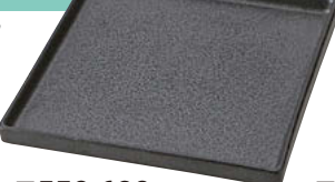
ラ559-628 21cmスクウェアプレート 21×21×2cm (磁) JPN 2,600円