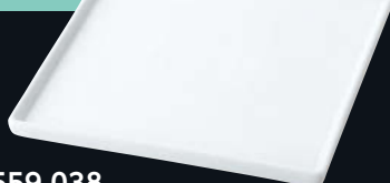
ラ559-038 24.5cmスクウェアプレート 24.5×24.5×2cm (磁) JPN 3,400円