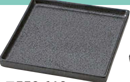
ラ559-618 18cmスクウェアプレート 18×18×2cm (磁) JPN 1,800円