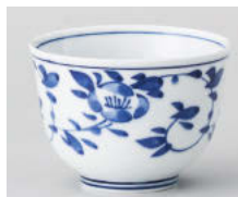
チ388-148 花唐草京煎茶 φ8×5.7cm(150cc) (強) JPN 1,100円