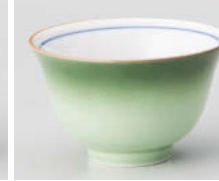
口388-098 緑彩反煎茶 φ9.2×5.5cm(160cc) (強) JPN 1,370円