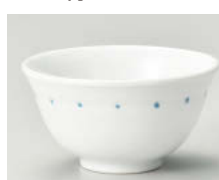
口388-318 千段水玉 反煎茶 φ9.5×5cm(170cc) (強) JPN 840円