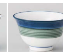
口388-288 二色ライン反煎茶 φ9.2×5.5cm(160cc) (強) JPN 860円