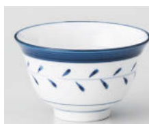
ホ388-208 新芽反煎茶 φ9.3×5.5cm(180cc) (強) JPN 900円