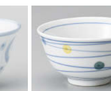
口388-308 四色水玉反煎茶 φ9.4×5cm(強) JPN 820円