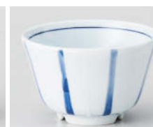
口388-218 一珍八本十草水切り浜煎茶 φ9.8×5.7cm(200cc) (強) JPN 920円