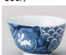
ア388-388 丸紋うさぎ厚口煎茶 φ9×5.2cm(170cc) (磁) JPN 820円