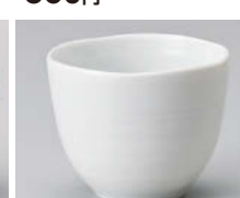
ミ388-398 白磁千段湯呑 φ8×6.4cm(磁) JPN 810円