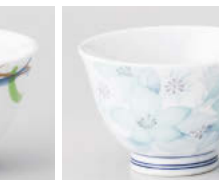
カ388-068 津和野反煎茶 φ9×5.8cm(170cc) (強) JPN 1,280円