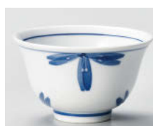
口388-258 一珍青花 反煎茶 9.3×5.6cm(150cc) (強) JPN 880円