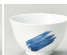
ハ388-338 呉須刷毛反煎茶 φ8.6×5.2cm(150cc) (強) JPN 860円