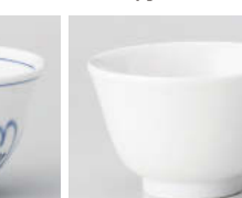
ホ388-368 白磁強化煎茶 φ9.2×5.8cm(200cc) (強) JPN 620円