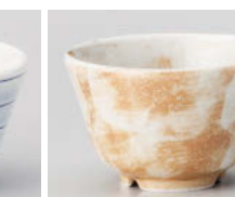
口388-238 刷毛白タタキ干茶 φ9.8×5.6cm(200cc) (強) JPN 920円