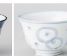
口388-298 丸紋反煎茶 φ9.2×5.5cm(160cc) (強) JPN 840円