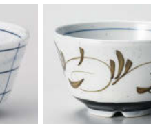
口388-188 梨地唐草 水切浜煎茶 9.3×5.7cm(160cc) (強) JPN 960円