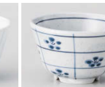
口388-178 梨地市松梅干茶 φ9.8×5.7cm(200cc) (強) JPN 980円