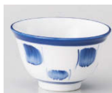
ホ388-198 かすり反煎茶 φ9.3×5.5cm(180cc) (強) JPN 900円