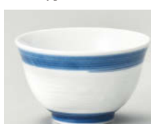
ハ388-328 呉須巻一珍反煎茶 φ8.6×5.2cm(150cc) (強) JPN 860円