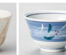
口388-248 彫唐草 反煎茶 9.3×5.6cm(150cc) (強) JPN 900円