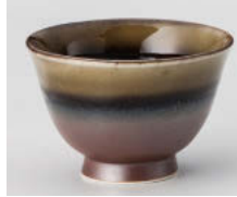
ア388-088 南蛮織部反煎茶 φ9.1×6cm(170cc) (強) JPN 1,650円