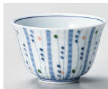
ウ388-018 色入点十草干茶 φ9.1×5.8cm(190cc) (強) JPN 2,320円