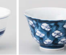
口388-128 梅づくし反煎茶 φ9.3×5.5cm(160cc) (強) JPN 1,060円