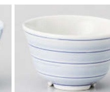
口388-228 吉祥駒筋干茶 φ9.8×5.7cm(200cc) (強) JPN 920円