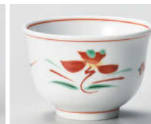
ホ388-038 赤絵花紋反煎茶 9×6cm(190cc) (強) JPN 1,750円