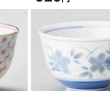
ホ388-428 薄墨さくら反煎茶(青) φ9×5.8cm(180cc) (磁) JPN 730円

表示価格、仕様などは予告なく変更となる場合があります。最新情報はWEBサイトにて必ずご確認ください(廃番含)。