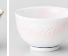
口388-108 ピンク花彫煎茶 φ8.9×5.3cm(160cc) (強) JPN 1,140円