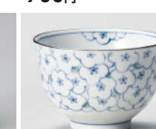
ホ388-408 花の海(青)煎茶 φ9×6cm(180cc) (磁) JPN 880円