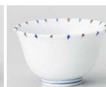
口388-278 淵二色十草反煎茶 φ9.2×5.5cm(160cc) (強) JPN 870円