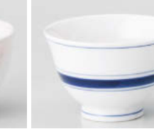
カ388-118 呉須ライン反煎茶 φ9×5.7cm(170cc) (強) JPN 1,100円