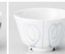
口388-168 間取り渦水切り浜煎茶 φ9.8×5.7cm(200cc) (強) JPN 980円