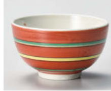
口388-078 駒筋 京煎茶(赤) 9×5.2cm(160cc) (強) JPN 1,600円