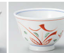
カ388-048 手描き京小花反煎茶 φ9×5.8cm(160cc) (強) JPN 1,700円