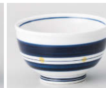
口388-158 帯水玉煎茶 φ9×5.1cm(160cc) (強) JPN 1,040円