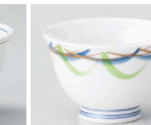
ホ388-058 吉祥反煎茶 φ9×6cm(180cc) (強) JPN 1,950円