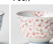
ホ388-418 花の海(赤)煎茶 φ9×6cm(180cc) (磁) JPN 880円