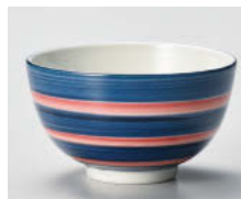
口388-138 駒筋 京煎茶(青) 9×5.2cm(160cc) (強) JPN 1,090円