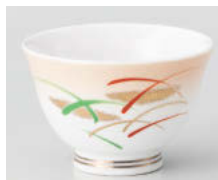
カ388-028 加茂川反煎茶 φ8.8×5.8cm(160cc) (強) JPN 2,000円