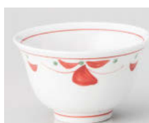
ア388-268 花紋反煎茶 φ9.3×5.5cm(160cc) (強) JPN 800円