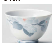
ホ388-378 清華反煎茶 9.4×6cm(190cc) (磁) JPN 1,150円