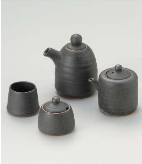
ヲ295-078 錆黒汁次(大) 約250cc(陶) JPN 2,500円 ヲ295-088 錆黒汁次(小) 約160cc(陶) JPN 2,100円 ヲ295-098 錆黒辛子入 4.5×5.5cm(陶) JPN 1,580円 ヲ295-108 錆黒楊子入 4×4.5cm(陶) JPN 1,250円