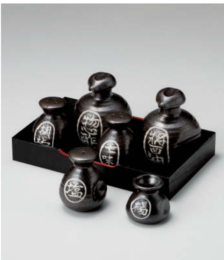
イ295-338 黒水晶ペコ型 ソース入 φ8.1×10cm(190cc) (磁) JPN 1,450円 イ295-348 黒水晶ペコ型 醬油入 φ8.1×10cm(190cc) (磁) JPN 1,450円 イ295-358 黒水晶ペコ型 胡椒入 φ6×7.3cm (磁) JPN 960円 イ295-368 黒水晶ペコ型 七味入 φ6×7.3cm (磁) JPN 960円 イ295-378 黒水晶ペコ型 塩入 φ6×7.3cm (磁) JPN 960円 イ295-388 黒水晶ペコ型 楊枝入 φ5.4×4.8cm (磁) JPN 600円 イ295-398 塗盆 23×14×3.3cm JPN 1,800円