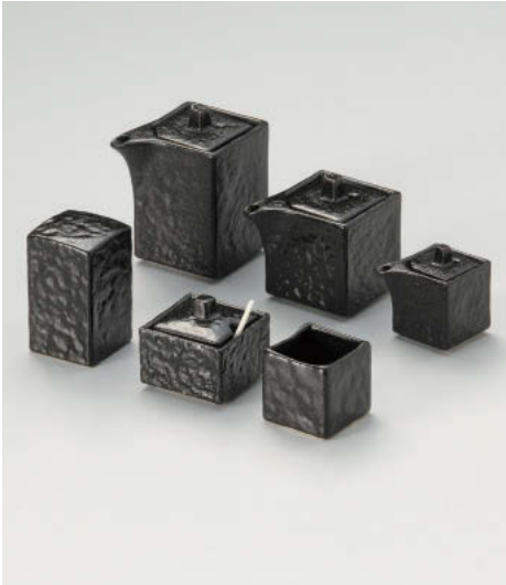
□295-018 瀬戸黒四角汁次(大) 9.5×6×9cm(200cc) (磁) JPN 2,250円 □295-028 瀬戸黒四角汁次(小) 9×6×7cm(140cc) (磁) JPN 2,010円 □295-038 瀬戸黒四角汁次(ミニ) 6.3×4×5.5cm(50cc) (磁) JPN 1,640円 □295-048 瀬戸黒四角カラシ入 5.5×5.5×5cm (磁) JPN 2,130円 □295-058 瀬戸黒四角一ツ穴 4.5×4.5×7.5cm (磁) JPN 1,700円 □295-068 瀬戸黒四角楊子入 4.5×4.5×4.5cm (磁) JPN 910円