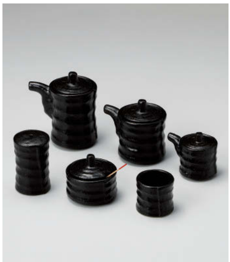
タ295-478 瀬戸黒つづみ汁次大 9×6×9.7cm(130cc) (磁) JPN 1,930円 タ295-488 瀬戸黒つづみ汁次小 8.4×6×7.8cm(100cc) (磁) JPN 1,780円 タ295-498 瀬戸黒つづみ辛子入 φ6×5.5cm (磁) JPN 1,710円 タ295-508 瀬戸黒つづみふりかけ φ4.3×7cm (磁) JPN 1,480円 タ295-518 瀬戸黒つづみミニ汁次 6.5×4.5×5.1cm(50cc) (磁) JPN 1,370円 タ295-528 瀬戸黒楊枝入 φ4.5×4cm (磁) JPN 820円 タ295-538 薬味スプーン 8cm CHN(木) 270円