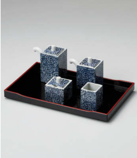
ヨ295-188 タコ唐草 角ソース入 8×5×9cm(140cc) (磁) JPN 2,100円 ヨ295-198 タコ唐草 角醬油入 7.5×4.7×8cm(100cc) (磁) JPN 2,000円 ヨ295-208 タコ唐草 角辛子入 4.8×4.8×5cm (磁) JPN 1,800円 ヨ295-218 タコ唐草 角楊枝入 3.7×3.7×5cm (磁) JPN 1,200円 ヲ295-228 (P)長角受台 26×16×2cm JPN 1,130円