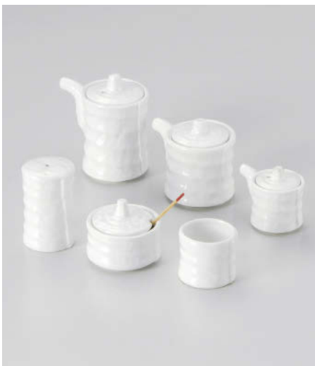
タ295-408 白磁つづみ汁次大 φ5.9×9.2cm(150cc) (磁) JPN 1,930円 タ295-418 白磁つづみ汁次小 φ6×7.3cm(100cc) (磁) JPN 1,780円 タ295-428 白磁つづみ辛子入 φ6.1×4.5cm (磁) JPN 1,710円 タ295-438 白磁つづみふりかけ φ4×7cm (磁) JPN 1,480円 タ295-448 白磁つづみミニ汁次 φ4.5×5.5cm(50cc) (磁) JPN 1,370円 タ295-458 白磁つづみ楊枝入 φ4.5×3.9cm (磁) JPN 820円 タ295-468 薬味スプーン 8cm CHN(木) 270円