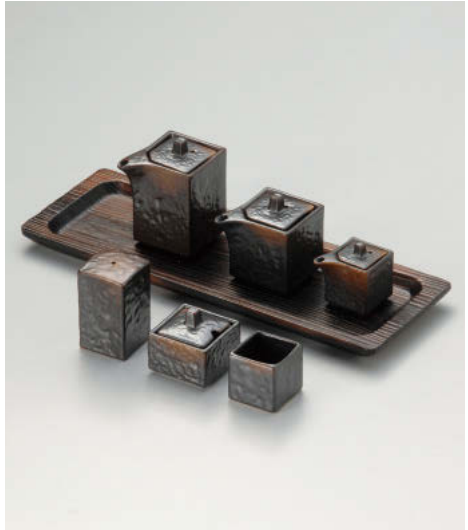
□295-118 焼締四角汁次(大) 9.5×6×9cm(200cc) (磁) JPN 2,250円 □295-128 焼締四角カラシ入 5.5×5.5×5cm (磁) JPN 2,130円 □295-138 焼締四角汁次(小) 9×6×7cm(140cc) (磁) JPN 2,010円 □295-148 焼締四角一ツ穴 4.5×4.5×7.5cm (磁) JPN 1,700円 □295-158 焼締四角汁次(ミニ) 6.3×4×5.5cm(50cc) (磁) JPN 1,640円 □295-168 焼締四角楊子入 4.5×4.5×4.5cm (磁) JPN 910円 ヲ295-178 焼木目長角トレー 35×12×H2.3cm CHN 1,300円