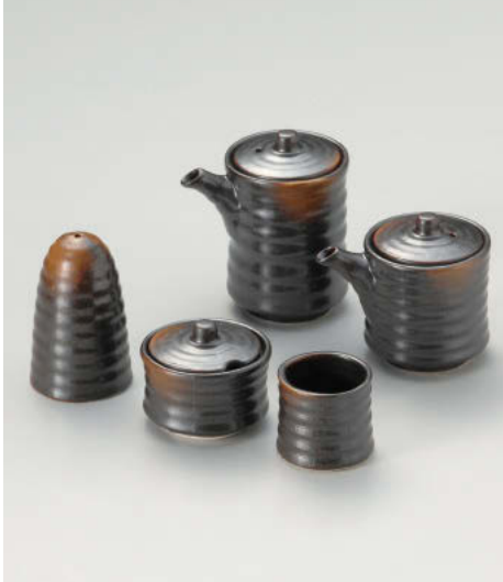
ト295-238 焼締汁次(大) φ6.4×10.2cm(200cc) (磁) JPN 1,650円 ト295-248 焼締汁次(小) φ6.4×8.2cm(130cc) (磁) JPN 1,450円 ト295-258 焼締辛子入 φ6.5×5.7cm (磁) JPN 1,370円 ト295-268 焼締塩入 φ5.2×8.2cm (磁) JPN 1,250円 ト295-278 焼締楊枝入 φ4.9×4.4cm (磁) JPN 720円