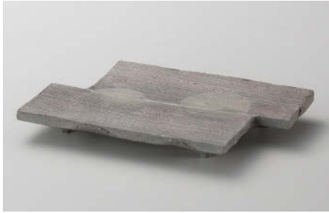
×142-018 炭化八ツ橋足付皿 24×16×2.5cm (陶) (信楽焼) JPN