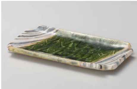
イ142-048 織部隅切焼き物皿 21.5×11.6×2cm (陶) JPN