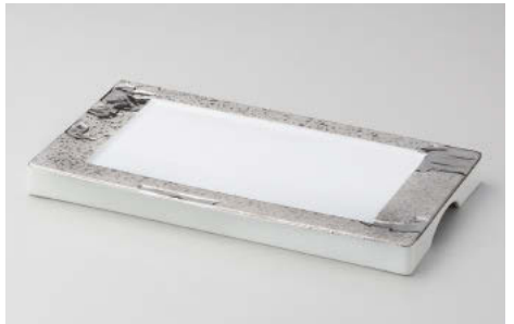
ツ142-068 漉プラチナ 長角皿 28×15.2×2.2cm (磁) JPN