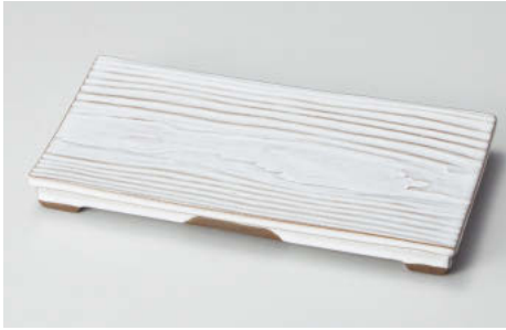
イ142-028 白釉木目まな板皿 24.5×13×2.5cm JPN