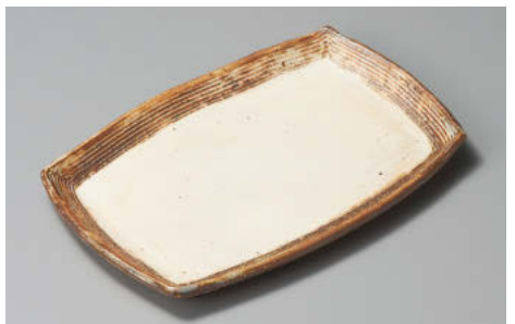
×142-098 漉荒横彫長方皿(中) 22×15.3×1.8cm JPN