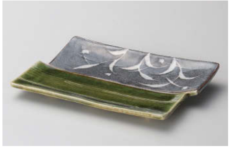
イ142-038 織部井桁焼き物皿 22×12×2cm (陶) JPN