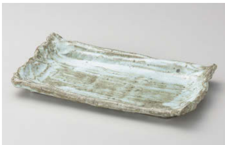
カ142-078 乾山土灰25cm長角皿 27.8×16.8×4.5cm (陶) JPN