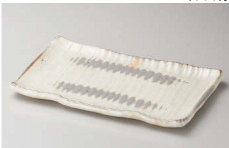
ミ142-168 粉引波彫長角盛皿 26×17×3cm (陶) JPN