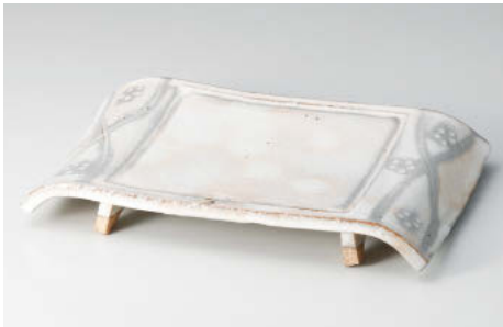
ミ142-058 手造り粉引華紋(土物)弓型8.5前菜皿 26×16×3.8cm (陶) JPN