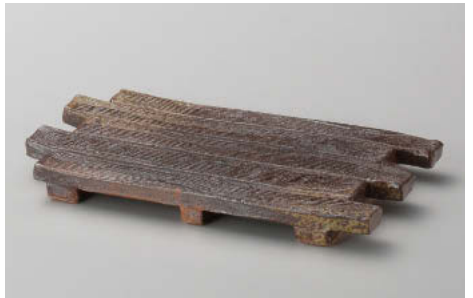
ミ142-148 備前風 イカダ焼物皿 23×12.5×2cm (陶) JPN