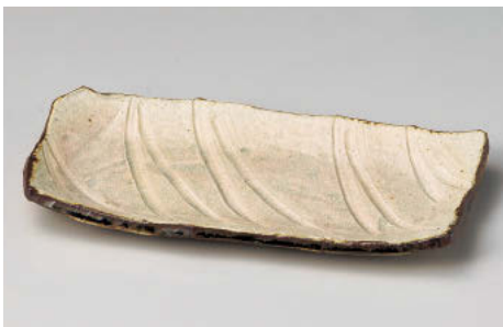
ト142-088 淡緑長角皿 26×12.5×2.5cm (陶) JPN