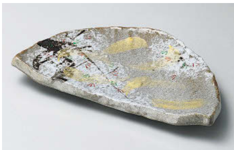
カ142-158 乾山春秋半月前菜皿 24.5×13.5×3cm (陶) JPN