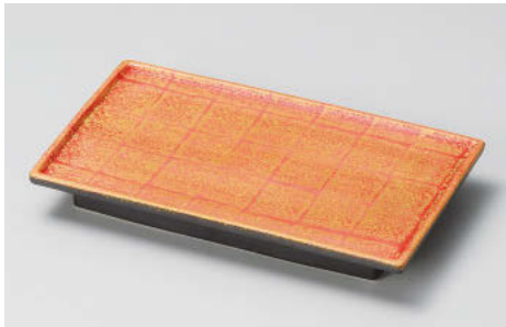
ト142-118 金彩市松長角7.0高台皿 21.4×12.6×2.6cm (磁) JPN