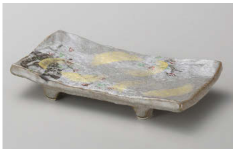
カ142-178 乾山春秋焼物皿 21×12×2.8cm (陶) JPN