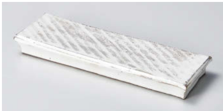
ト124-038 粉引櫛目高台突出皿 26.7×8.7×3cm(陶)JPN 7,650円