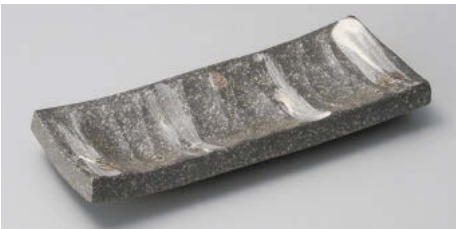
×124-058 黒窯変鍋8.0長角皿 24×10×2.8cm JPN 7,500円