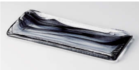
ハ124-088 水墨長角皿小黒(ガラス) 24×10×1.1cm(ガ)JPN 5,400円