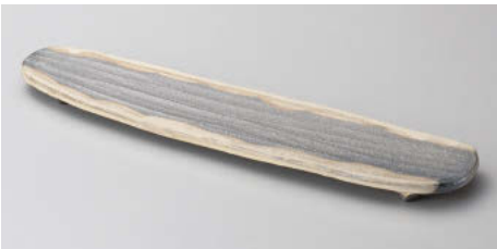
×124-028 黒窯変掛け分け変型長皿 41×10.5×3cm(陶)(信楽焼)JPN 10,000円