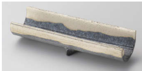
×124-078 黒窯変掛け分け6.7足付長皿 20×6.5×3.8cm(陶)(信楽焼)JPN 5,650円