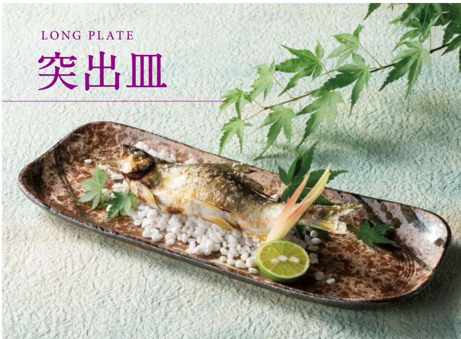
×124-018 黒窯変掛け分け14.0足付長皿 43×7×4cm(陶)(信楽焼)JPN 11,100円