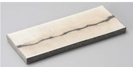
×124-118 白化粧掛け分け7.6長角皿 23×10×1.8cm JPN 5,500円