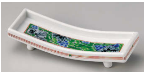
ミ124-128 九谷風内ブドウ舟形前菜皿 27×9.5×5.7cm(磁)JPN 5,300円