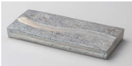
×124-068 黒窯変櫛目9.0長角皿(両面使用可) 27×12×2.8cm(陶)(信楽焼)JPN 6,650円