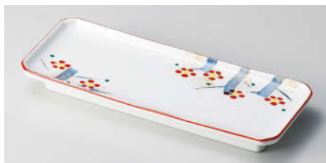
ア124-138 手描き梅園突出皿 23.8×8.6×2.5cm(磁)JPN 4,750円