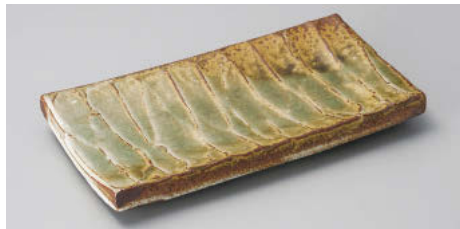
×124-048 ビード口鍋8.0長角皿 24×10×2.8cm JPN 8,500円