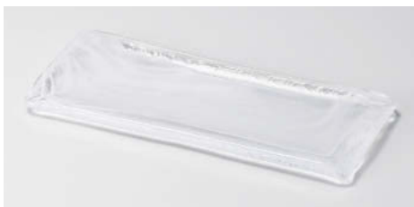
ハ124-098 水墨長角皿小白(ガラス) 24×10×1.1cm(ガ)JPN 5,400円