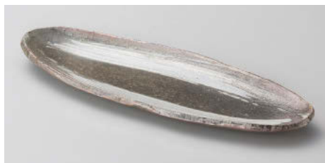
×124-108 刷毛目付突出皿 28.5×12×2.5cm(陶)(信楽焼)JPN 4,800円